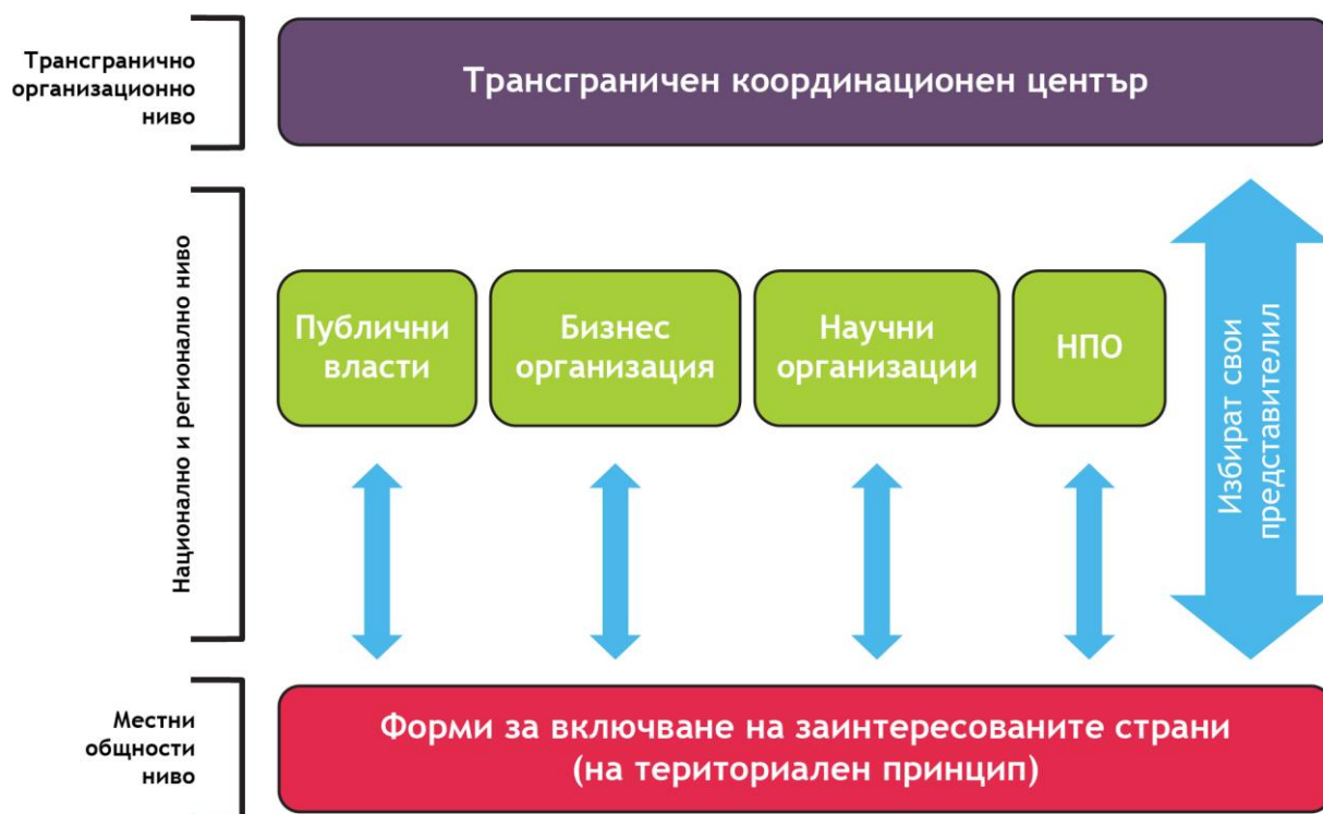
Фигура 2. Вариант 2. Съвместен механизъм за подкрепа на интермодални връзки

Силна страна и на двата варианта е участието на широк кръг заинтересовани страни в процеса на вземане на решения, както и възможността за двупосочна комуникация между участниците.